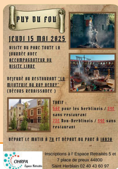
Puy du Fou le 15 mai