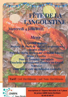
Fête de la Langoustine le 4 juin