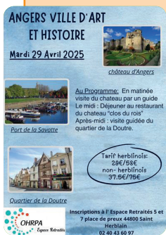
Angers le 29 avril